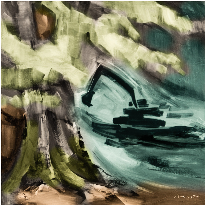
The Tree - huile sur toile - 80x80 cm