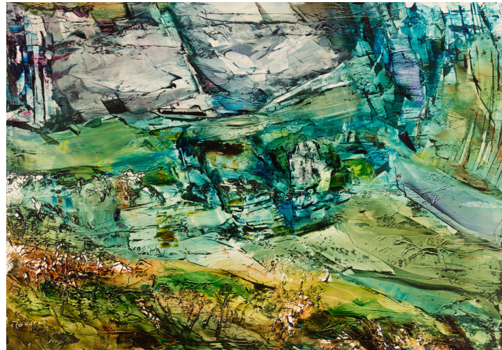
Forca - huile sur toile - 70x100 cm

Peintre et photographe franco américain, Jean-Pierre Rousset partage son temps entre le Pays basque et le Maine (USA). Son travail sur l'abstraction dans la nature a été récompensé par plusieurs prix internationaux prestigieux.